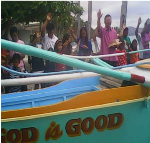
PRAYER OF THANKSGIVING OF THE NEW BOAT FOR LIVELIHOOD PROJECT ASSISTED BY ROTARY CLUB OF ALESUND NORWAY

BLESSING AND LAUNCHING OF PUMPBOAT APRIL 06, 2014